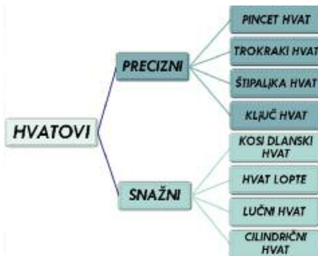
Slika 1 Hvatovi u kojima učestvuje palac

Procena snažnog ili pincet hvata sa velikom preciznošću određuje pet lako merljivih prediktora: pol, starosna dob, telesna visina, telesna težina i profesionalna aktivnost. (14)