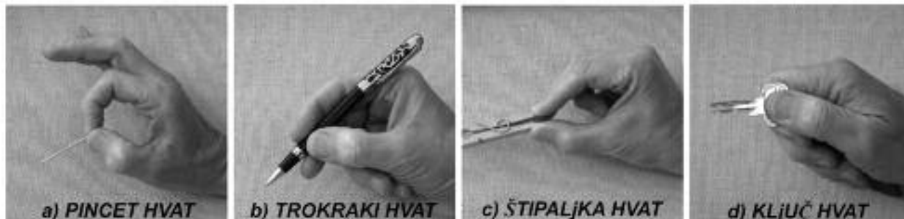
Slika 2 Precizni hvatovi

Starosna dob i snaga stiska tj. hvata su statistički značajni prediktori za spretnost ruke, čak jačina stiska više od starosne dobi. Ističući snagu stiska kao prediktora za